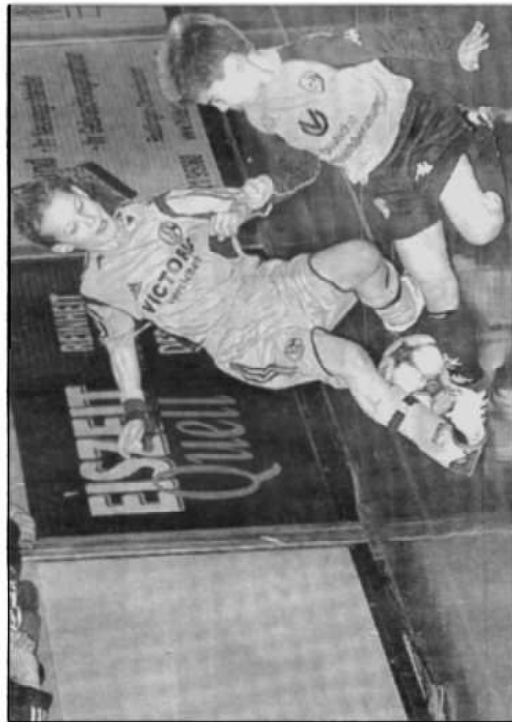
Der Kicker-Nachwuchs von Schalke 04 wird auch in diesem Jahr wieder in Münsingen erwartet.

Ich wünsche allen viel Spaß und Erfolg. Euer Spezialist für gute Sehen.