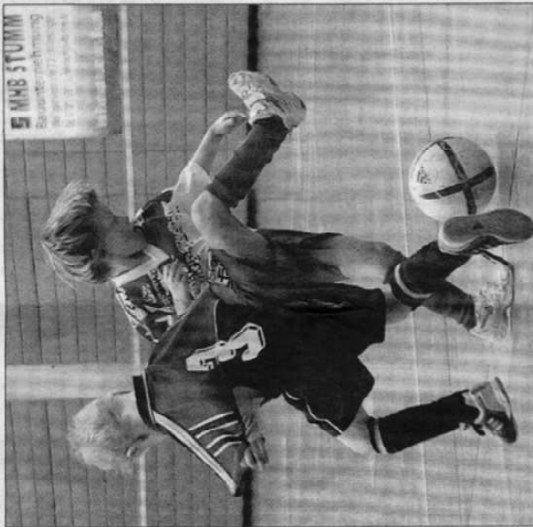
Übersteiger oder Überflieger? Beim MHB-Stumm-Cup zeigt auch viel Bundesliga-Nachwuchs sein Können.

Denn die Turniere der F- und E-Jugend, oder in neuem Sprachgebrauch U9 und U10, sind auf der Münsinger Alb einmalig und reißen sich nahtlos in die überregionalen Turniere des TSV Betzingen (U12) und des Ulmer U11-Turniers ein. „So trifft man sich immer wieder“, begründet Münsingens Abteilungsleiter Stefan Schwörer eine Neuerung gegenüber dem vergangenen Jahr, als die TSG noch ein U11-Turnier ausgeschrieben hatte. Wieder bieten sich Spielern, Betreuern und Organisatoren in nächster Umge-